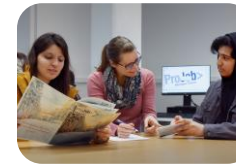
Vorbereitung auf die Berufsschule