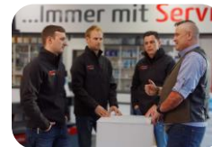
Betriebliche Lernphasen (Praktika)